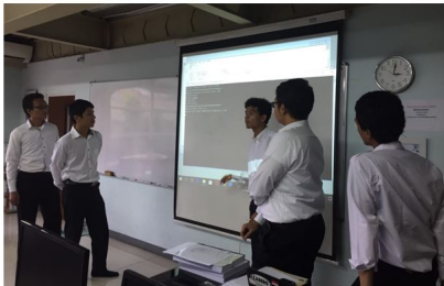
Gambar 4. Presentasi tugas besar program jual beli di pasar