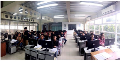
Gambar 1. Suasana Praktikum Prak. Pengantar Teknik Komputer