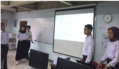
Gambar 3. Presentasi tugas besar program daftar menu restoran