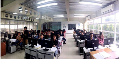
Gambar 1. Suasana Praktikum Prak. Pengantar Teknik Komputer